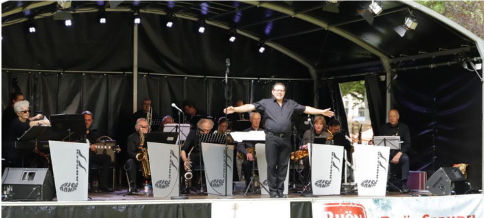
Das erste Swing&Wine Festival war ein voller Erfolg.